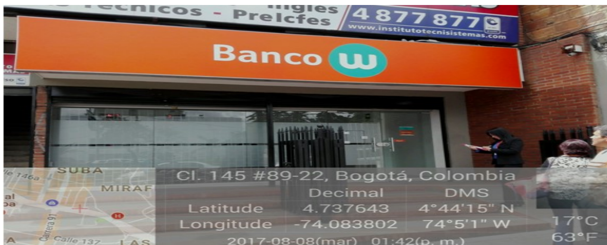
Fotografía No. 1. Fachada del predio donde se ubica el establecimiento de comercio objeto a estudio y donde se puede observar el elemento tipo aviso ubicado en el primer nivel de la edificación.