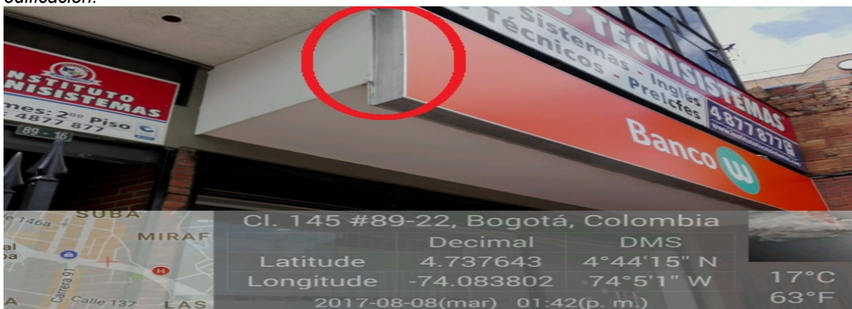
Fotografía No 2. Ubicación del elemento tipo aviso en el cual se puede observar que el elemento tipo aviso sobresale de la fachada.